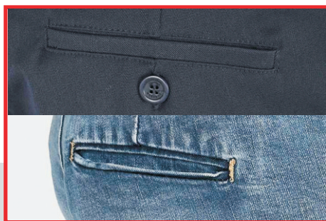
TASCA A FILETTO BOLSILLOS DE VIVO POCKET WELTING